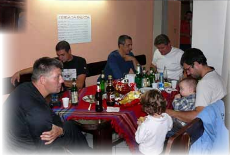
...неформални сесии за татковци...