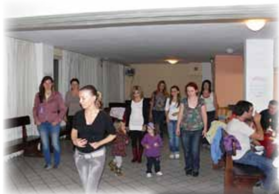
...разпускахме със салса-вечеринка...