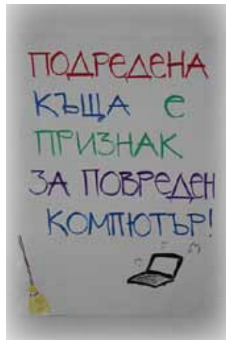
...ЛЛЛ изложбената маса...