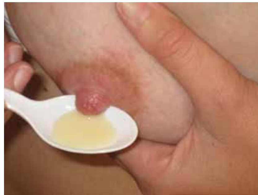
На снимката: изцеждане на коластра на ръка

Съберете възглавничките на палеца и показалеца си, като натискът е към гърдния кош, а не навън към зърното. Повтаряйте движението ритмично, докато се появят капки.