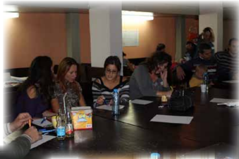
...оживени дискусии и работилници...