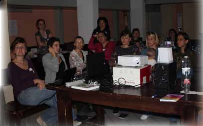
...имаше сериозни лекции, интересни презентации и вълнуващи уебинари...