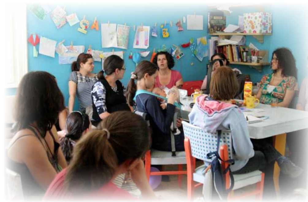
Ла Лече Лига групата в София